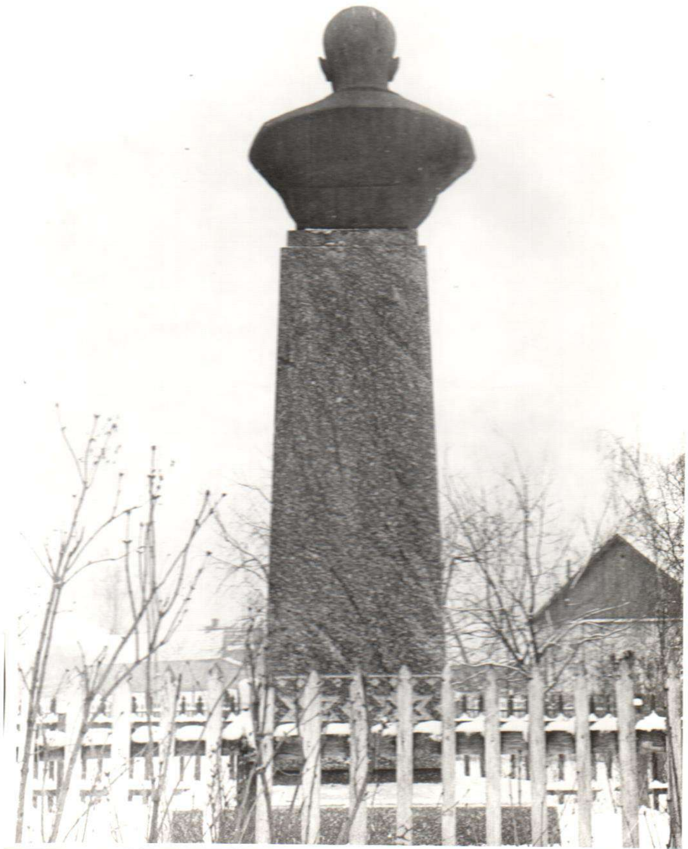
Пам"ятник П.К.Романенку Споруджений в 1962 р. С.Сосонка Вінницького р-ну Вінницької області. 1974 р.