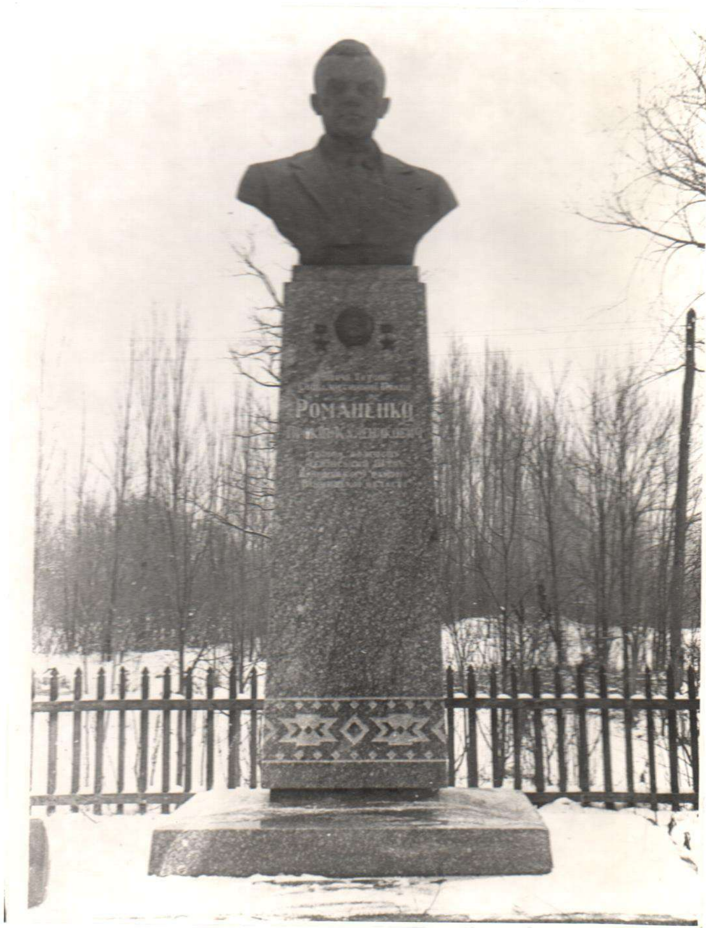
Пам'ятник П.К. Романенку