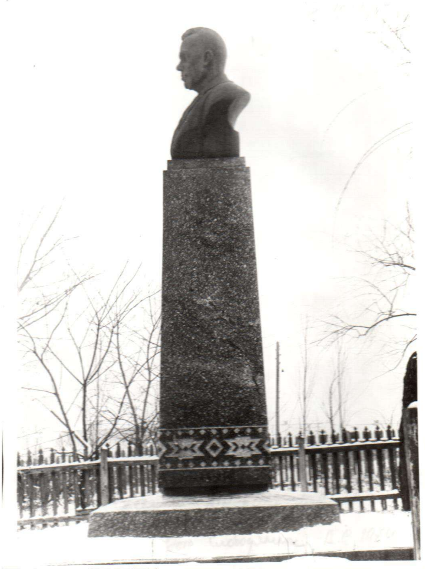
Пам'ятник П.К.Романенку Збудований в 1962 р. С.Сосонка Вінницького р-ну Вінницької області.