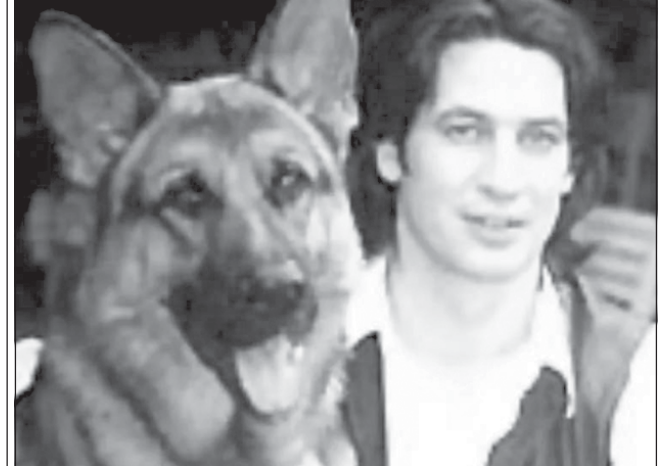
Собаку можна побачити у таких стрічках як «Комісар Рекс», «Я — легенда» та «К-9».

На екрані порода німецької вівчарки злетіла до неймовірної слави. Кількість появ у стрічках перевищує 550 разів.