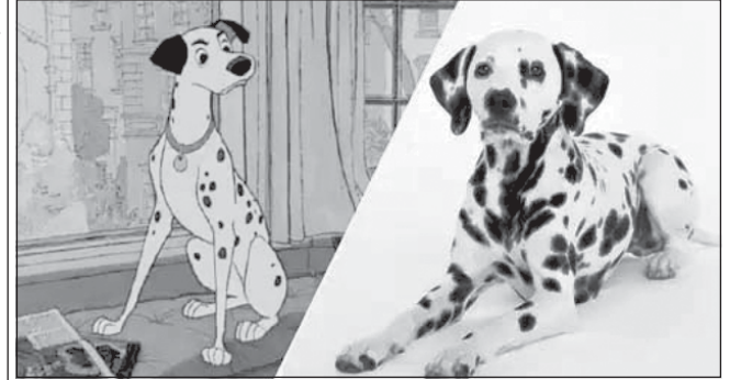
Втім, є й зворотна сторона такої популярності — лише за рік кількість далматинців у притулках зазнала значного зростання. Оскільки люди просто «повелись» на екранний образ, не дізнавшись унікальних рис породи, не могли впоратись з доглядом.

Після виходу анімаційного фільму «101 далматинець», діти по всьому світу вимагали у батьків придбати такого плямистого компаньйона.