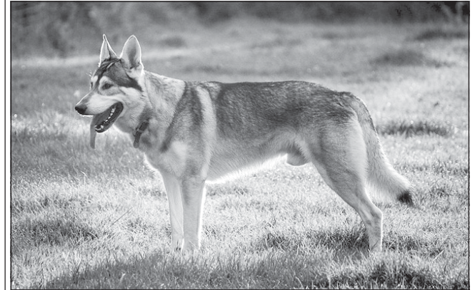
Ця порода, що має схожість з вовками та може похвалитись винятковим інтелектом, досі залишалась відносно невідомою. Їх дефіцит лише додає їм привабливості, роблячи справді винятковою знахідкою для любителів собак.

Північна інуїтська собака була на піку слави після того, як з'явилась в ролі лютововка у відомому телесеріалі «Гра престолів».