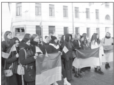
«Сьогодні як ніколи важливо пам'ятати, що наша сила — в єдності! До 105-ї

22 січня, у Вінниці провели акцію «Живий ланцюг єднання». На площі Небесної сотні зібралась молодь з жовто-блакитними прапорами. Про це повідомляють у Вінницькій обласній військовій адміністрації.