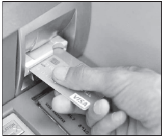
Як повідомляють у відділі комунікації поліції Вінницької об-

До 8 років ув'язнення світить 19-річному жителю Одеської області. У Вінниці, у банкоматі хлопець побачив залишену кимось картку, скористався нею, витративши впродовж одного дня понад 10 тисяч гривень. На пошуки «щасливчика» у поліціантів пішло більше тижня.