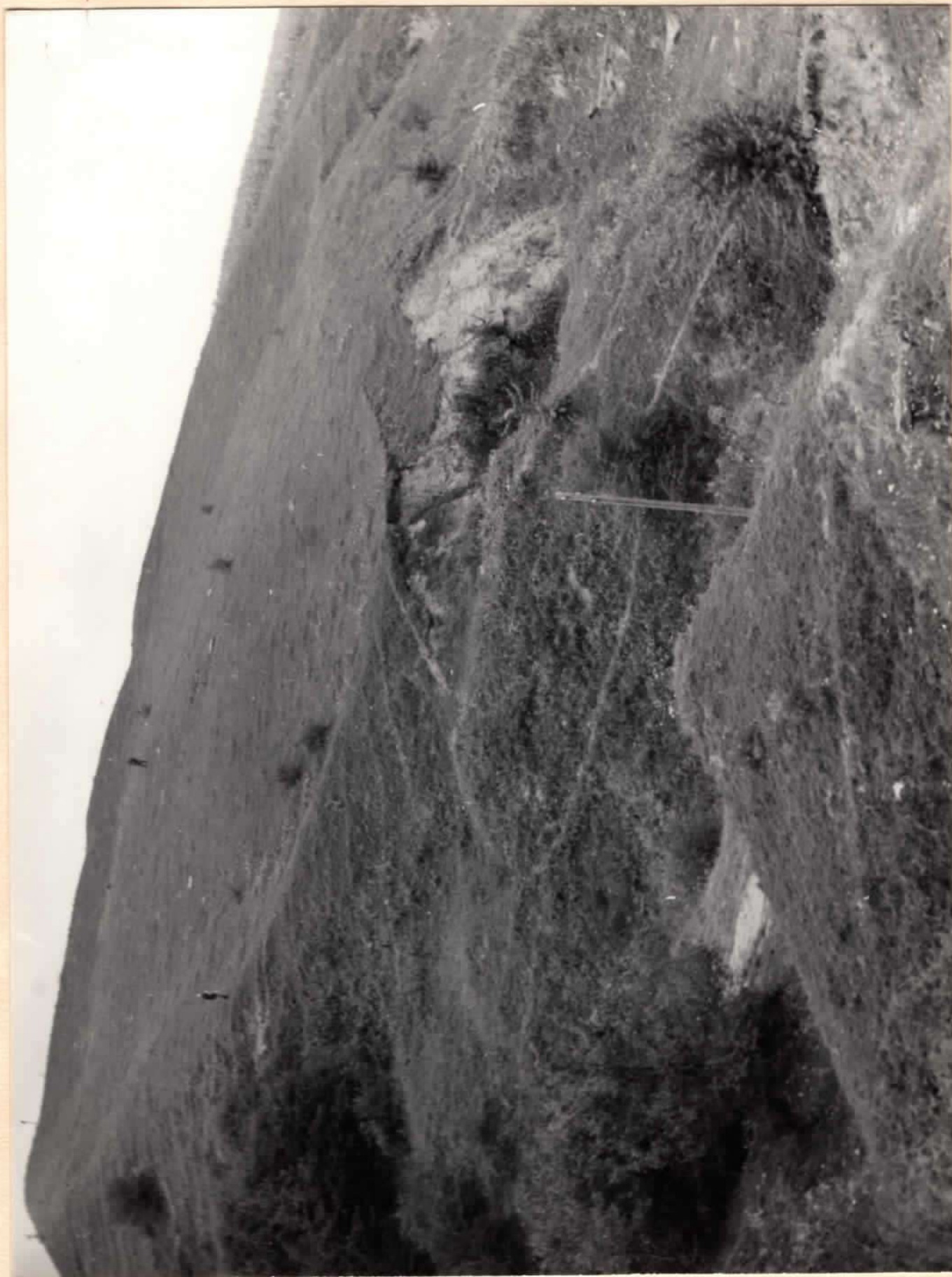
Слов'янське городище X - XI ст.ст. н.е./загальний вигляд/

Вінницька обл., Мурованокурі ловецький р-н, с.Попелюхи.