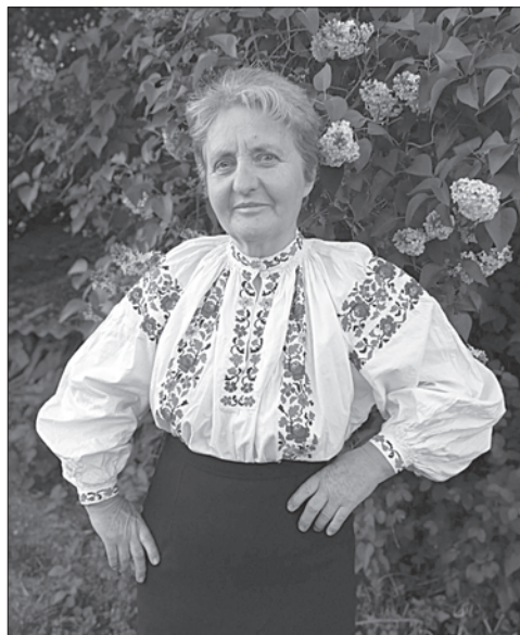
І вірять, що закінчиться війна Й прийде в мій край жадана Перемога.

Мої вірші - то є моя душа, Що мріє і звертається до Бога